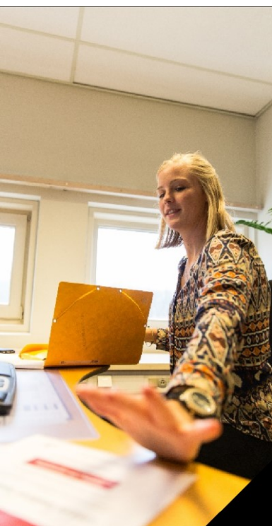
Professionsbachelor i Offentlig administration